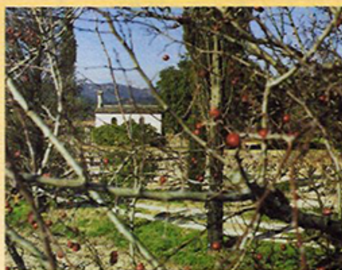
La Chapelle dans les vignes Hameau "Les Gastons" Commune du Plan de la Tour (Var)

Cet ouvrage, écrit dans un style particulièrement enlevé, enrichi de nombreuses illustrations en couleur, présente un contenu fortement documenté aussi bien sous un angle sociologique, voire ethnologique, que sous un angle purement juridique.