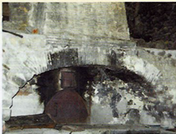
Le très beau four bien entretenu du Hameau du Revest" Commune du Plan de la Tour (Var)

Agrégé des Facultés de Droit Professeur à l'Université de Droit et de Sciences Politiques d'Aix-Marseille Avocat au Barreau de Marseille