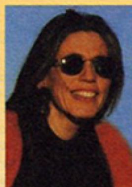
L'auteur : Corinne DOUBLAT

Il pourra même se révéler indispensable à la recherche de vraies solutions conformes au droit et aux usages en vigueur face aux nombreuses difficultés que rencontrent les ayants droit confrontés à d'incessantes tentatives d'annexion de la part de certains d'entre eux pour un usage privatif exclusif.