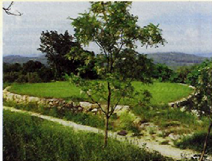
L'aire de battage des "Sigalloux" entièrement restaurée au pied du village Commune de Flayosc (Var)