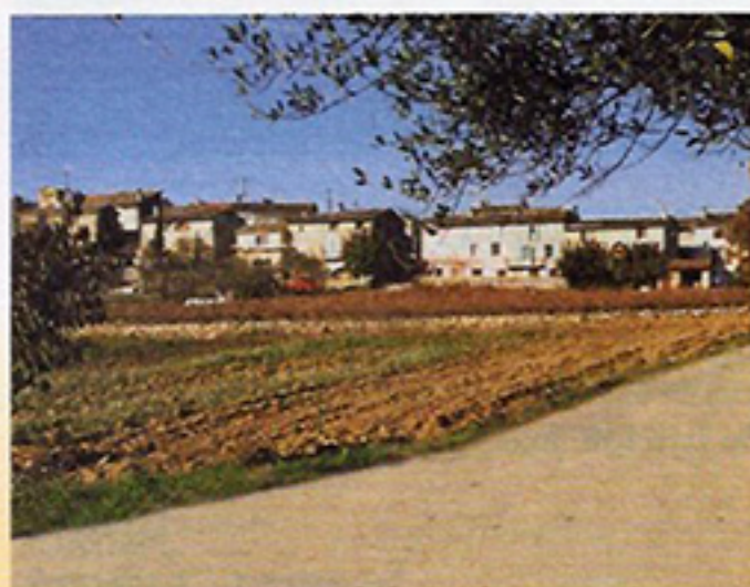
Le très ancien "Hameau Saint-Jaume" Commune de Lorquès (Var) Les terres cultivées viennent lécher les maisons